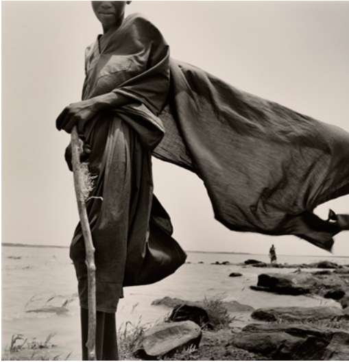
Mali berger Peul, 1997

Au musée de Grenoble Du 4 avril 2026 au 23 août 2026