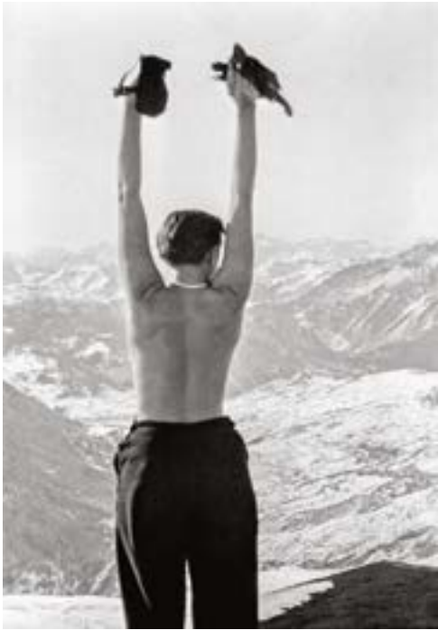
Charlotte Perriand brandissant ses gants depuis l'hôtel Principi à Sestrière, Alpes piémontaises, 1929