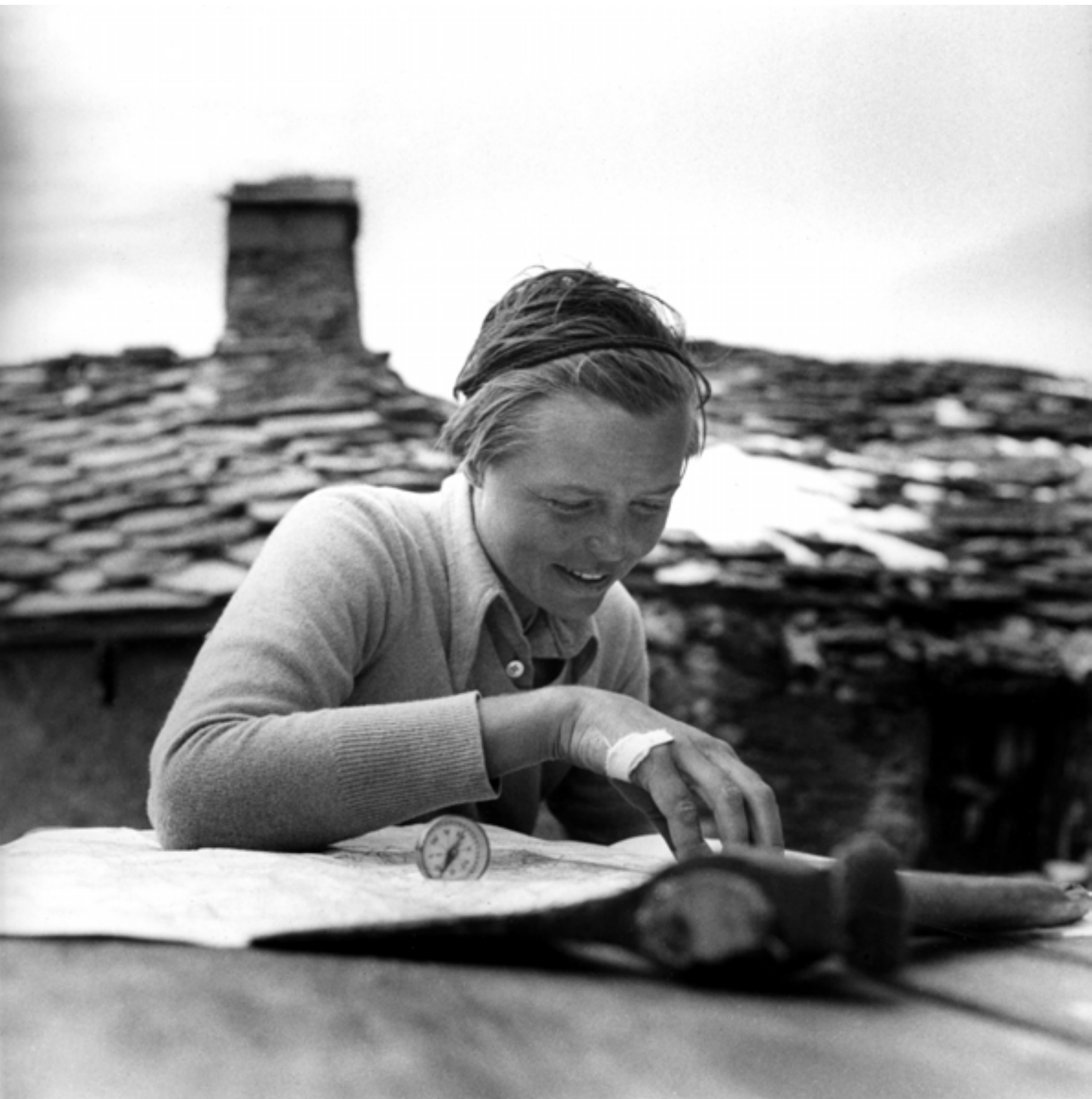
Charlotte Perriand préparant une course en montagne au refuge d'Entre-Deux-Eaux, parc national de la Vanoise, Savoie, 1932, Anonyme © ADAGP, Paris 2026