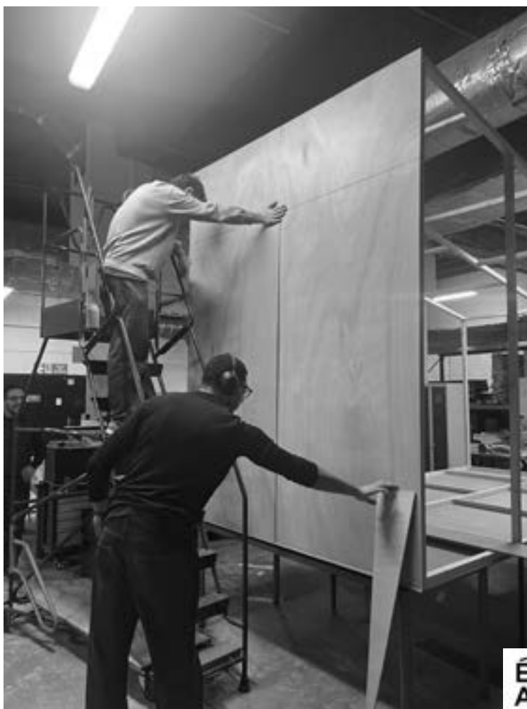
Fabrication en cours à l'École Nationale Supérieure d'Architecture de Grenoble