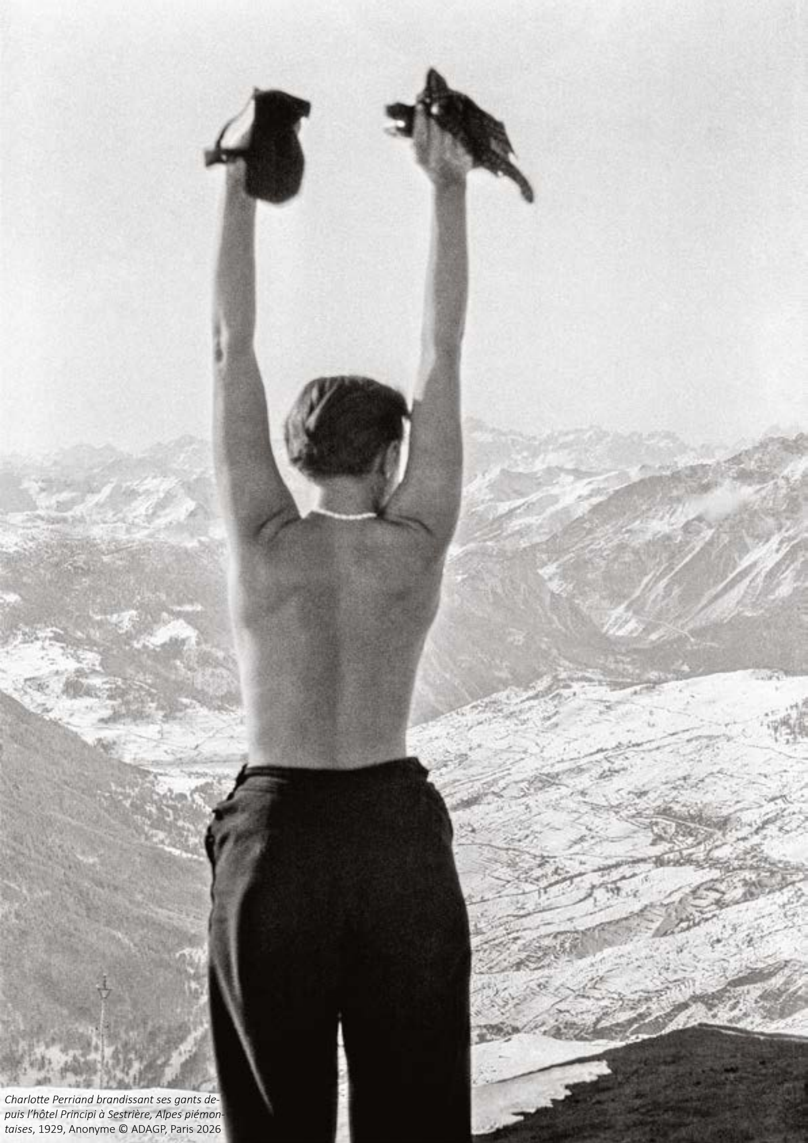
Charlotte Perriand brandissant ses gants depuis l'hôtel Principi à Sestrière, Alpes piémontaises, 1929, Anonyme © ADAGP, Paris 2026