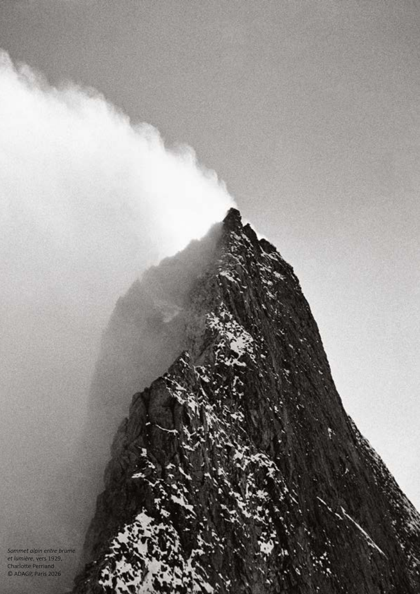
Sommet alpin entre brume et lumière, vers 1929, Charlotte Perriand © ADAGP, Paris 2026