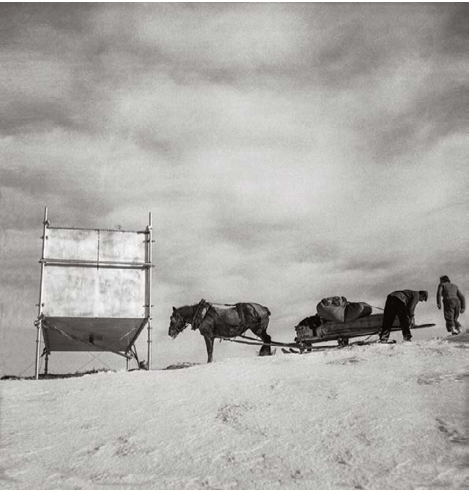
Ravitaillement du refuge Bivouac sur le col du mont Joly, Saint-Nicolas de Véroce, Haute Savoie, 1938, Charlotte Perriand © ADAGP, Paris 2026