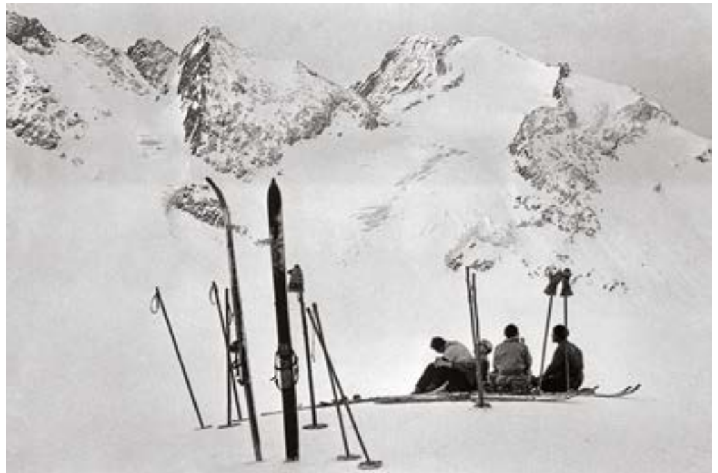
La pause. Ski de randonnée en Oisans, Isère et Hautes-Alpes, vers 1929, Charlotte Perriand © ADAGP, Paris 2026

Cette exposition inédite met en lumière un aspect méconnu de son œuvre : 59 photographies de montagne, réalisées entre 1927 et 1938, tirées par les Archives Charlotte Perriand et données au musée de Grenoble. Ces images dialoguent avec ses créations et révèlent un univers où la montagne est une véritable matrice de création.