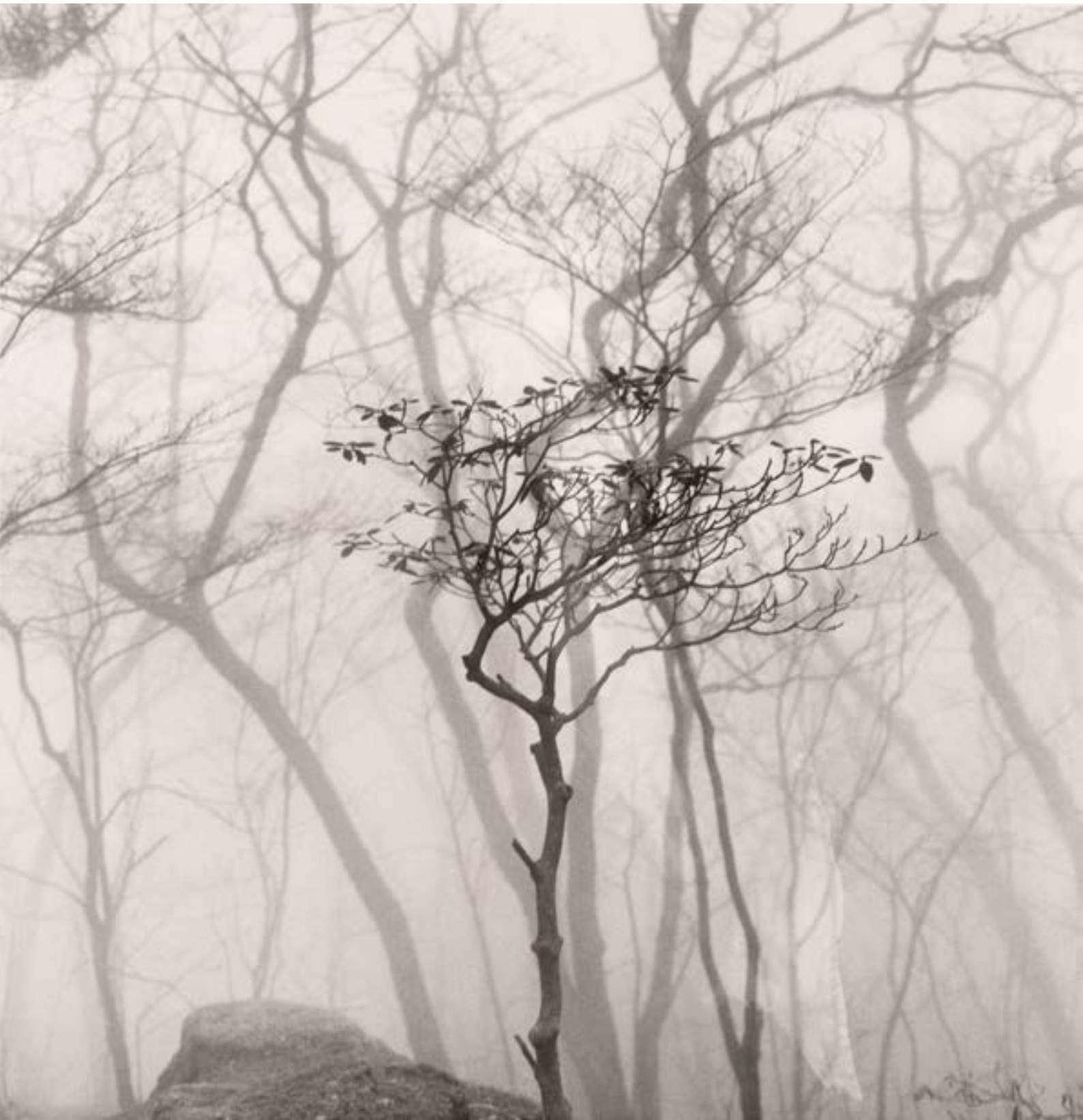
Chine Huan Chang 2012