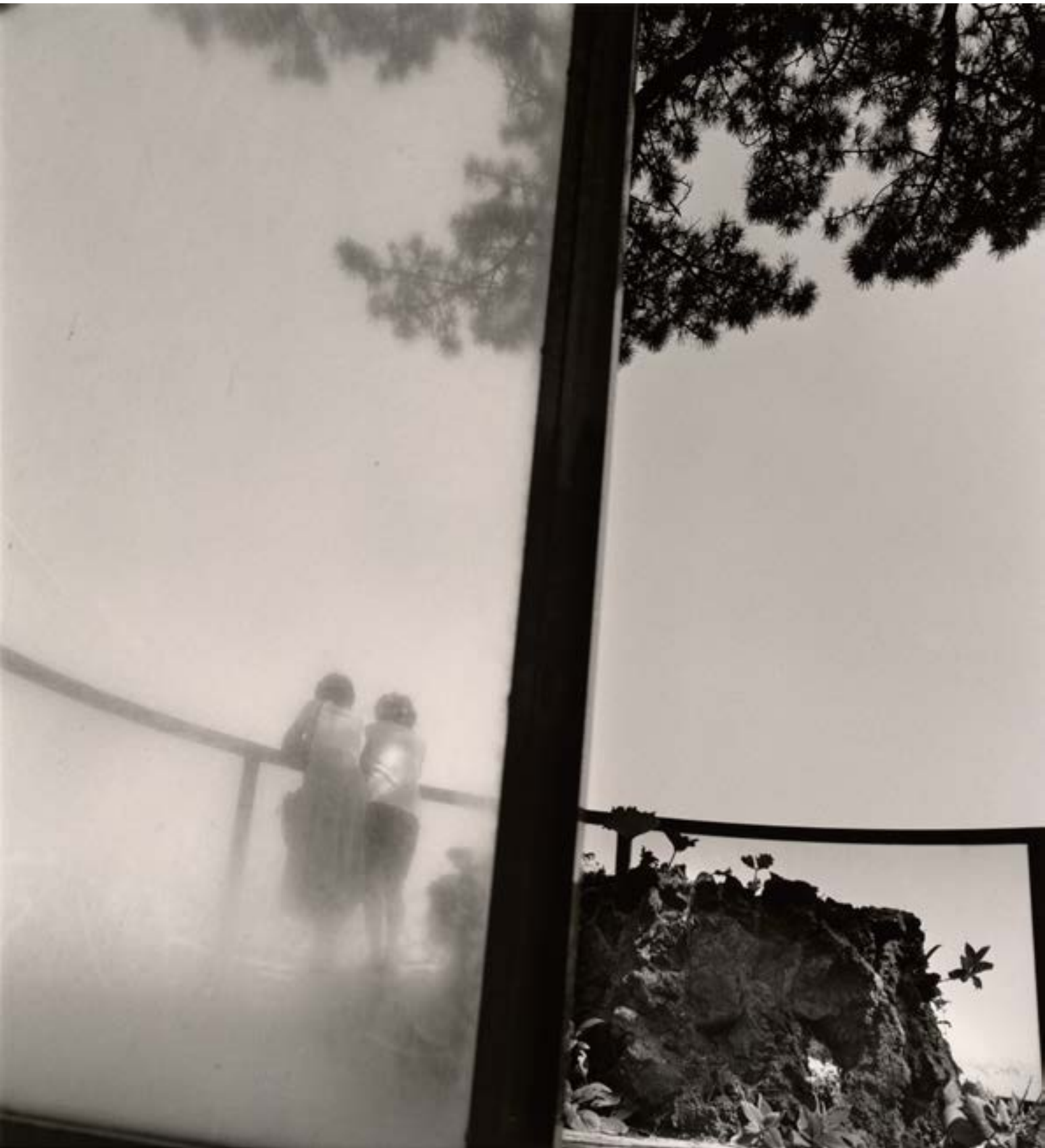
Japon Atami , 1993