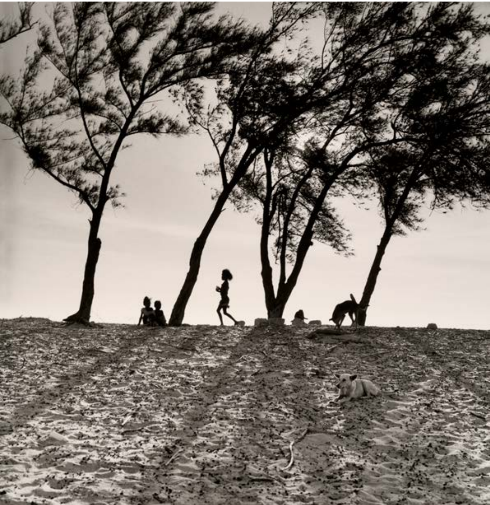
Madagascar Sarondrano