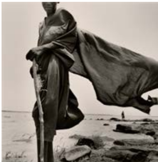
Mali berger Peul, 1997

Au musée de Grenoble Du 4 avril 2026 au 23 août 2026