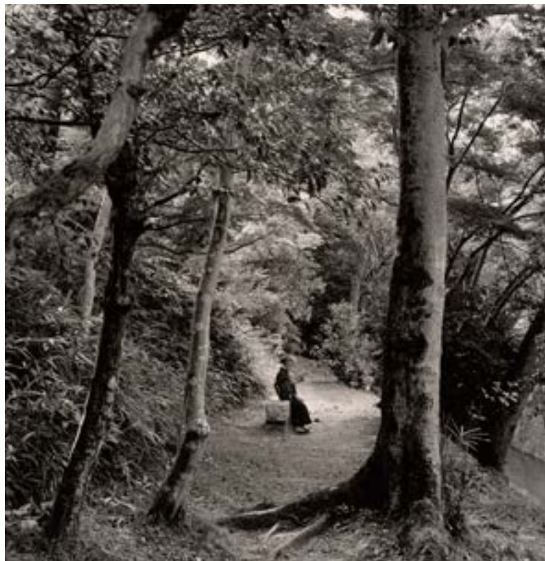
Japon Kyoto chemin de la philosophie, 1994

Dans cette narration du temps le photographe s'amuse, s'émeut, médite et capture toujours l'instant de façon instinctive. Ni photographie de voyage, ni enregistrement mémoriel, l'image de Descamps s'impose comme une invitation à faire ce petit pas de côté permettant de découvrir notre Terre autrement. Par son jeu d'ombres et de lumières qui l'inscrit dans le sillage de Kertesz, l'artiste crée un récit original qui lui permet de recomposer une vision du monde au-delà des apparences.