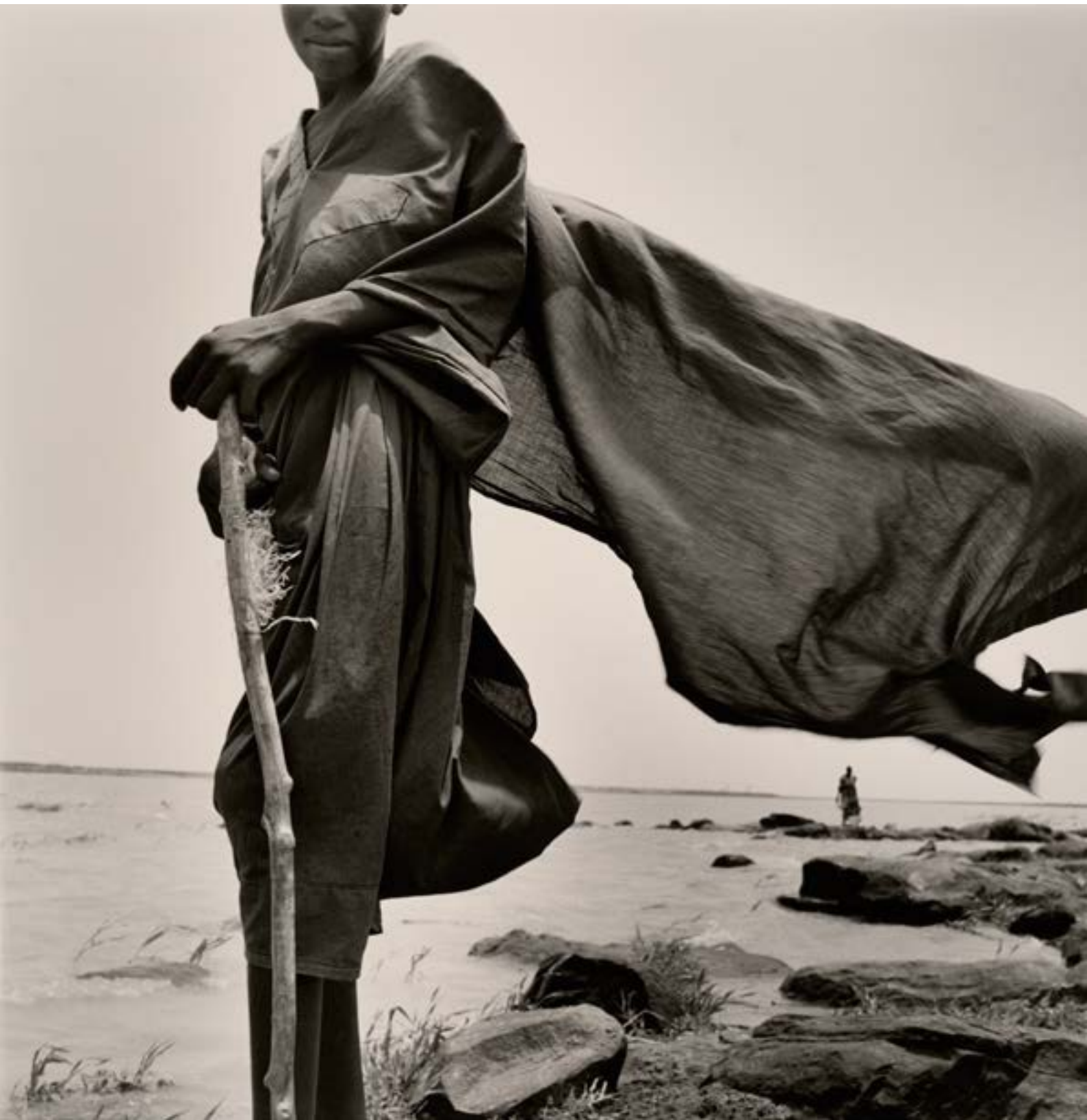
Mali berger Peul 1997